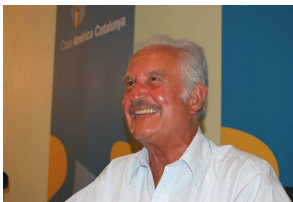
El escritor mexicano y premio Cervantes de Literatura, Carlos Fuentes, presentó en Casa Amèrica Catalunya su última novela, “Todas las familias felices”, publicada por la editorial Alfaguara