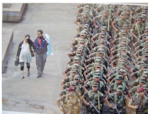
Indios de Santa Cruz de La Laguna de Atitlán Sin título. Moisés Castillo. Guatemala, 2004. Anónimo. 1880