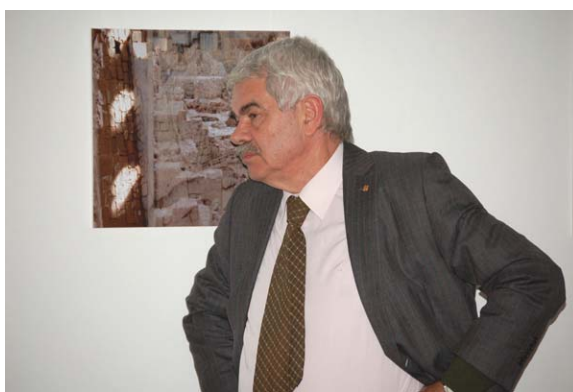
El presidente de la Generalitat de Catalunya, Pasqual Maragall, asistió a la presentación de “Tinta Roja”

“Tinta Roja” es un documental que explica la experiencia del Partido Revolucionario de los Trabajadores – Ejército Revolucionario del Pueblo. Anécdotas y análisis, motivaciones, emociones, miedos e ilusiones, contadas desde la perspectiva de hoy, 30 años después de la desaparición de este grupo revolucionario argentino.