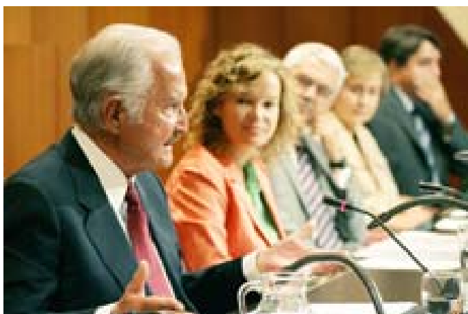
Carlos Fuentes obsequió al auditorio con una magnífica disertación sobre las estrechas relaciones entre México y España y Catalunya